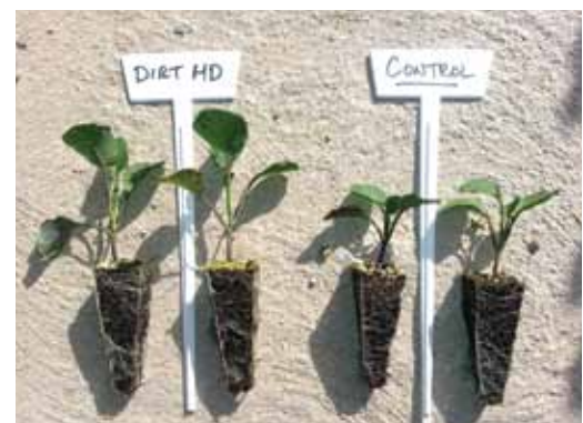
Brassica - post germinación a 53 días

Llama a Ocean Agro si quieres saber más!